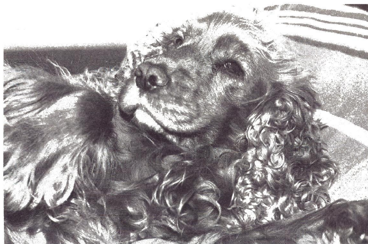
Søvnig hund i blitzlys.

Eksponeringskontrol: Centervejet måling ved fuld blændeåbning via SPD (Silicon Foto Diode) sensor, EV 1 til EV 18 (100